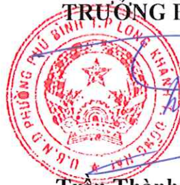
Trần Thành Huy